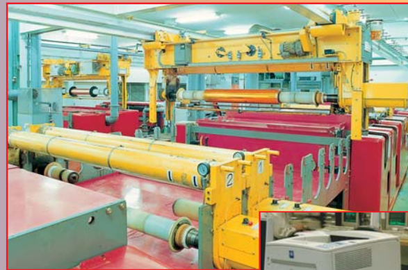
●ブーメランシステム