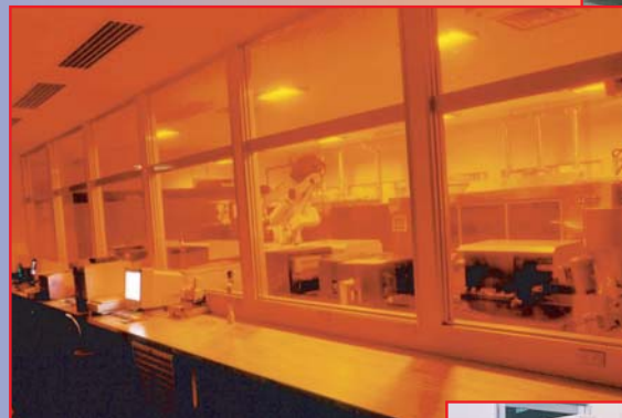
●レーザーシステム